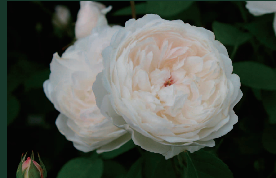
グラミス キャッスル 作出年：1992年 作品：マクベス

主人公マクベスはグラミスの領主であり、グラミスキャッスルは作品に登場する城のモデルとなっています。