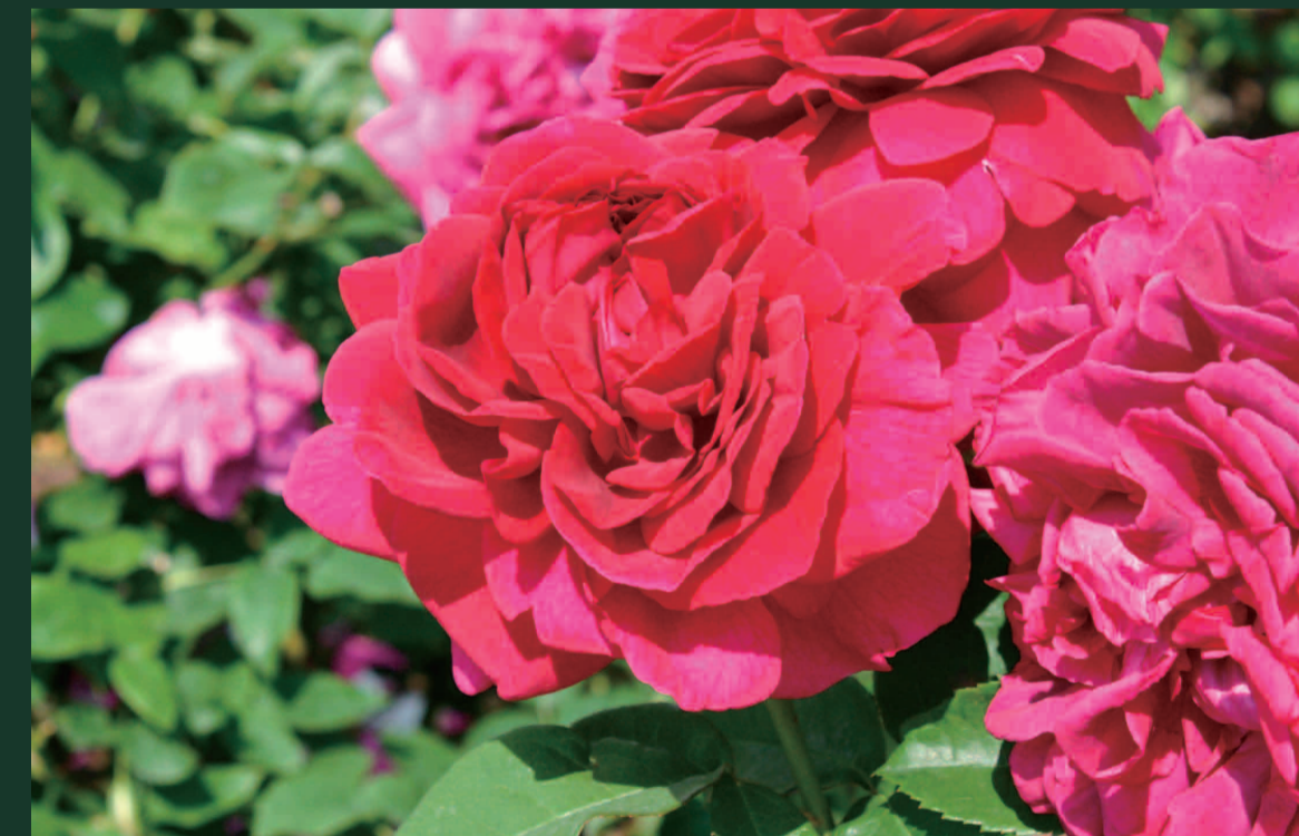
ザ ダークレディ 作出年：1991年 作品：ソネット集(詩編)

「This royal throne of kings, this scepter'd isle…」からはじまるランカスター公の有名な台詞で、イングランドを指す言葉です。