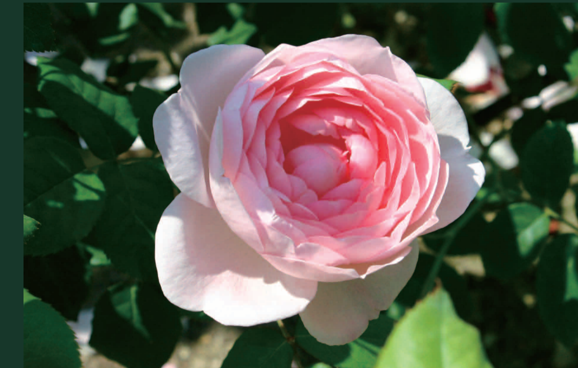
セプタード アイル 作出年：1996年 作品：リチャード二世

主人公マクベスはグラミスの領主であり、グラミスキャッスルは作品に登場する城のモデルとなっています。