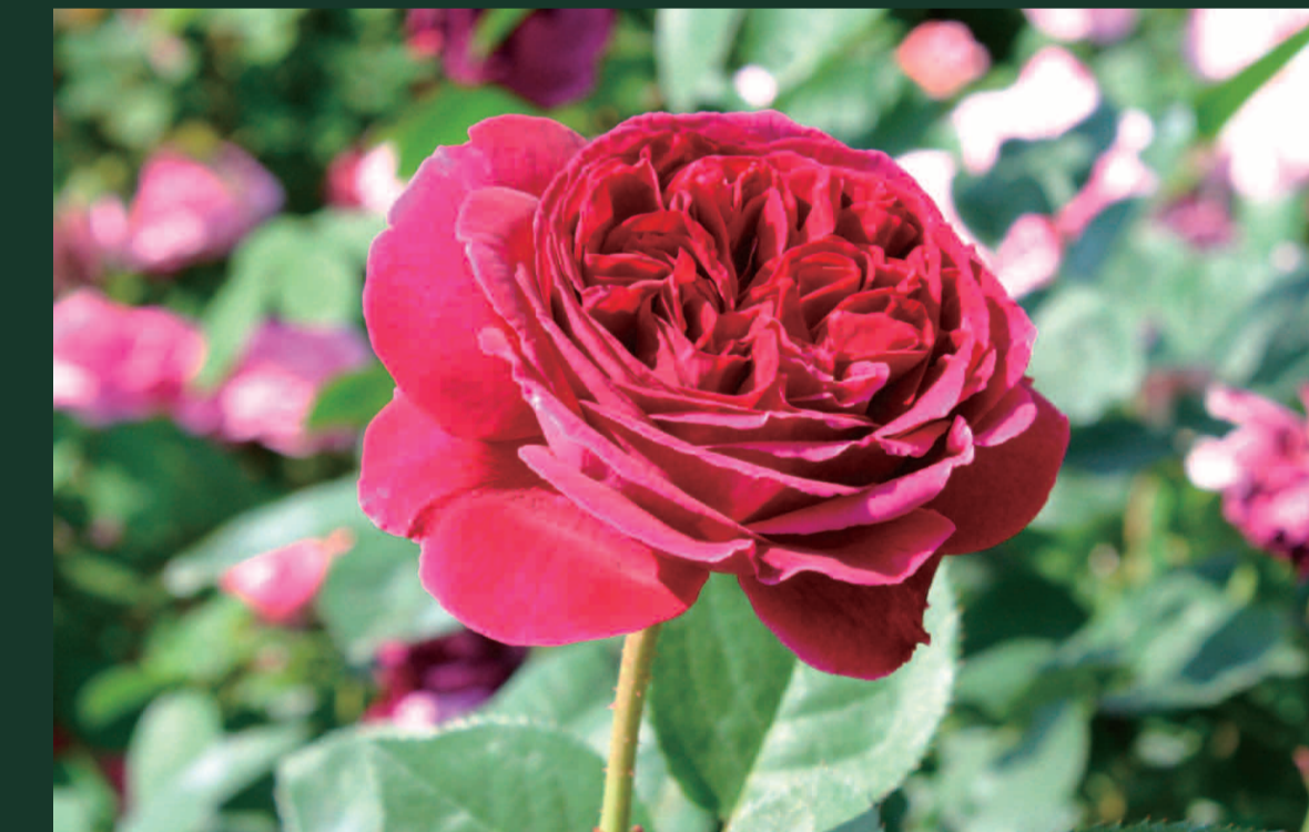
フォールスタッフ 作出年：1999年 作品：ウィンザーの陽気な女房たちなど

全154篇のうち127番から152番で、「The Dark Lady」という女性への愛が歌われています。