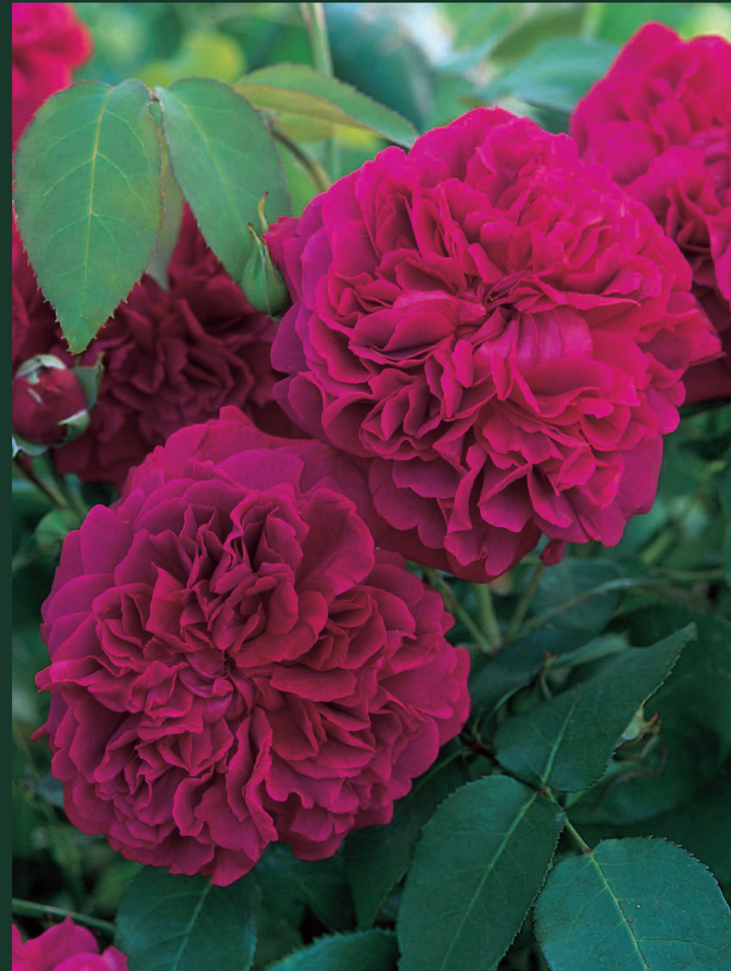
ウィリアム シェイクスピア 2000 作出年：2000年