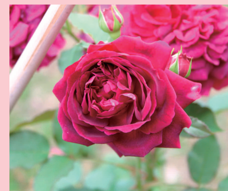
ムンステッド ウッド